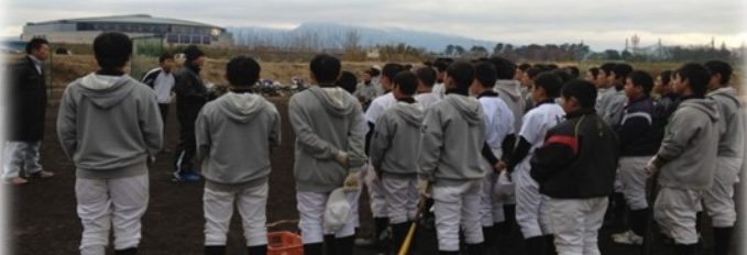
元フロ野球選手による野球教室