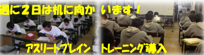
週に2日は机に向かいます!