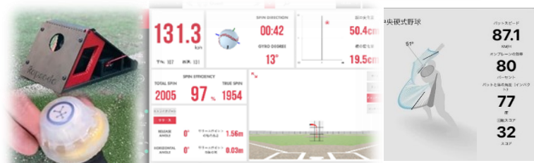
ラフソード・フラスト導入、見える化推進